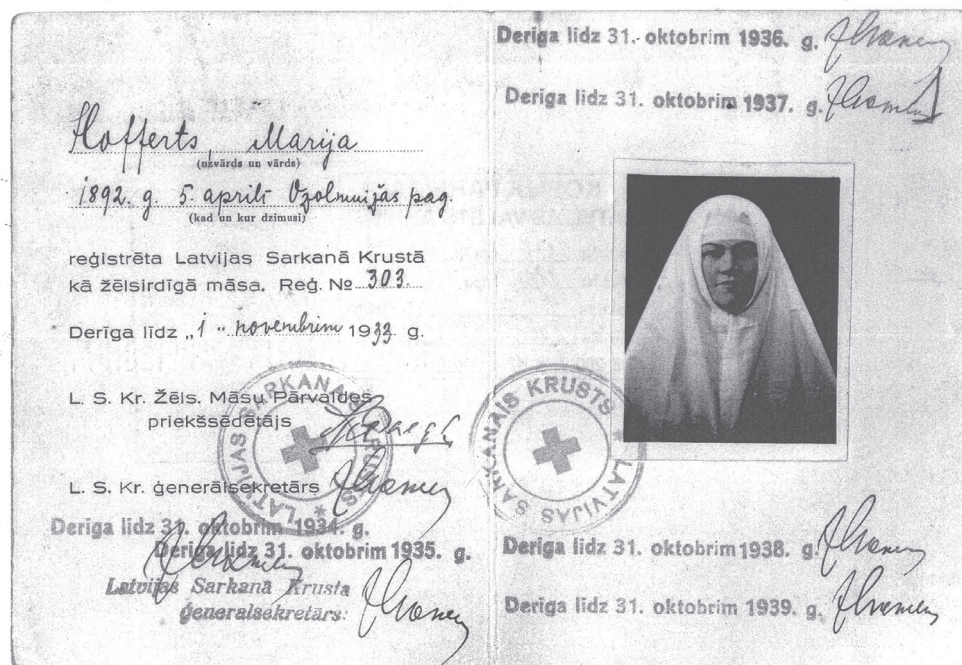
Žēlsirdīgās māsu reģistrācijas apliecība (LVA, 2176. f., 2-v. apr., 88.l., 1.lp.)