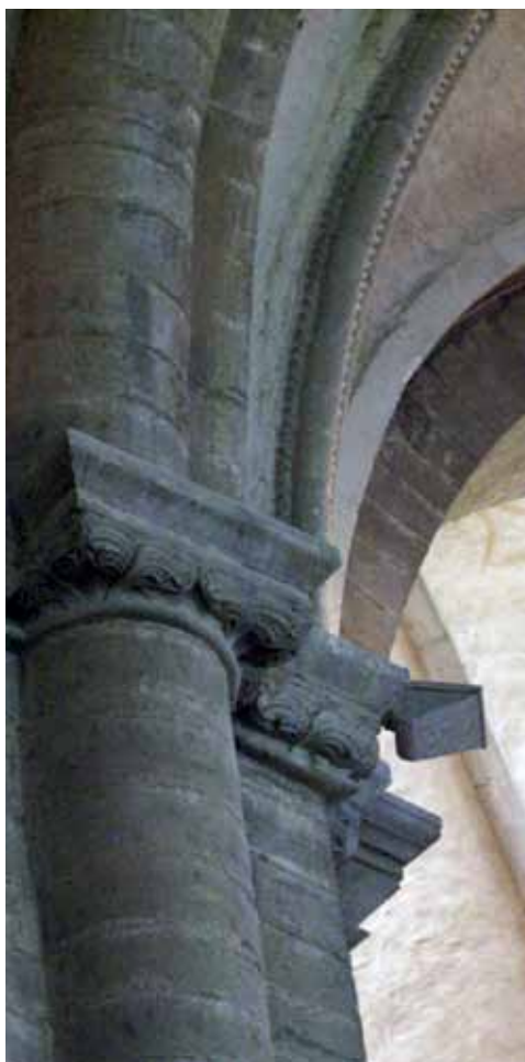
7. att. Linčēpingas Doms. Halles garenjoma palmešu dekorī

stilistiskās izteiksmes līdzekļos — noapaļotās formās un noslēgtās kontūrās, kuras nosaka gluds, nestrukturēts kalums mīkstā, it kā pietūkušā plastiskumā. Motīva pastiprinātā stilizācija un ornamentāla vienkāršošana, sasāsinot formu proporcionālās attiecības, līdzinās Augšreinas reģiona vēlās romānikas stila fāzes būvplastikai, piem., 1239. g. pabeigtajā un iesvētītajā Maincas ( Mainz ) Domā 14 . Iespējamie ietekmju ceļi Rīgas Doma virzienā līdz šim nav apzināti. Baltijas jūras reģionā Rīgas Doma dekorīem formāli un stilistiski tuvas analogijas atrodamas Linčēpingas Doma ( Linköping ) halles posma baznīcas interjera kapiteļu dekoros, kas tapuši laika posmā no aptuveni 1250. līdz 1310. g. 15 (7. att.). Šķiet, ka Rīgā un Linčēpingā, tāpat kā Maincā, pastiprinātas stilizācijas iezīmes būvplastikā apliecina vēlās romānikas stila posma dekoru motīvu un formu krājuma izsmēlumu, kas šos objektus satuvina vispārīgā Eiropas tēlniecības attīstības kontekstā.