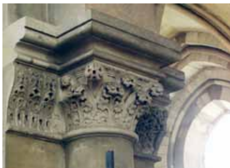
14. att. Magdeburgas Doms. Kora ejas pumpuru kapitēlis

Franču gotikas katedrāļu būvplastiku prototipi iedvesmojuši arī Rīgas Doma kapitula zāles saišķu kolonnu kapitēļu dekorus. Ar