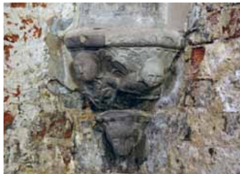
15. att. Rīgas Doms. Kapitula zāles konsole (kz–ko10)

Dekoru paraugu aizgūšanu no Magdeburgas Doma kora ejas būvplastikas apstiprina vairākas Rīgas Doma kapitula zāles un krustejas plastikas. Pamatojoties gan uz Rī-