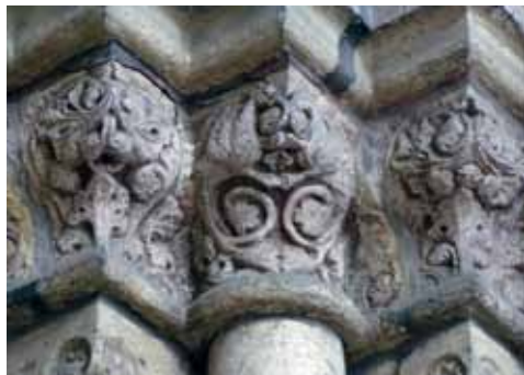
10. att. Rīgas Doms. Ziemeļu portāls. Labās puses kapitelis