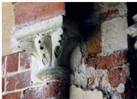
6. att. Rīgas Doms. Krusteja. D korpusa kapitelis (k-k14b)