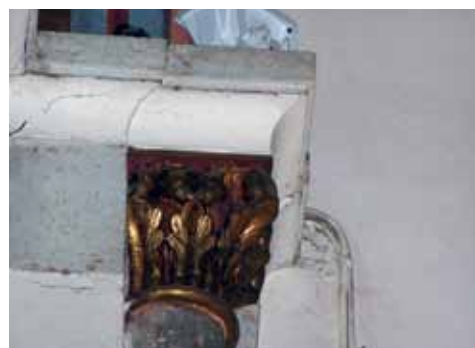
3. att. Rīgas Doms. Interjera kapiteļis (i-k4)

tīvu piemēriem. Tomēr Rīgas Doma būvmeistara dekora izpildījuma stilistika ievērojami atšķiras no smalki izstrādātajiem Reinzemes paraugu kalumiem. Rīgas Doma ziemeļu apsīdas kapiteļa plastikā saskatāmas tādas