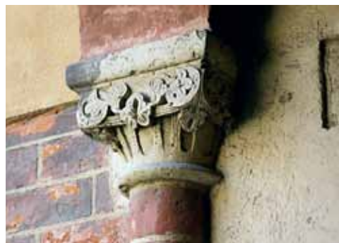
20. att. Rīgas Doms. Krusteja. R korpusa kapitelis (k-k8b)