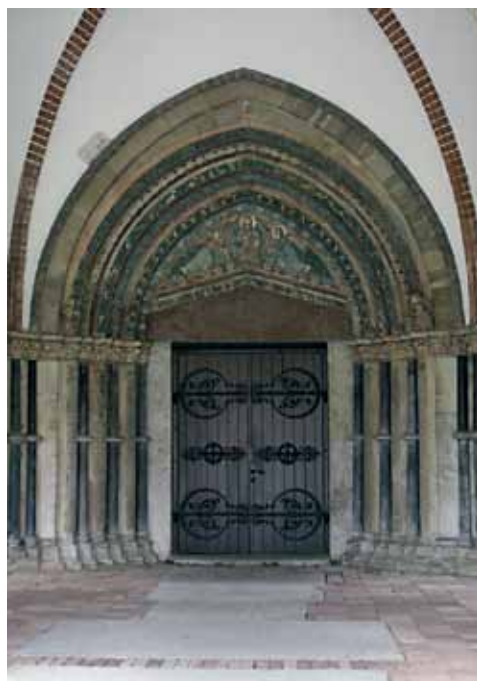
9. att. Lībekas Doms. Paradīzes portāls