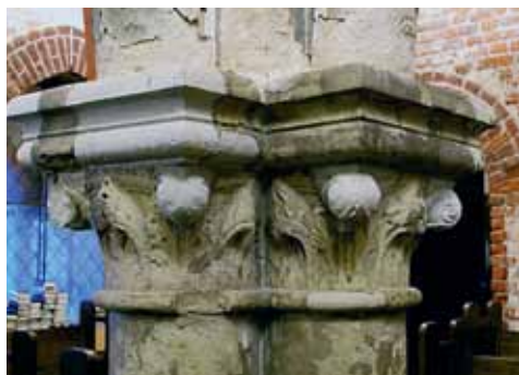
13. att. Rīgas Doms. Kapitula zāles Z saišķa D un A puse