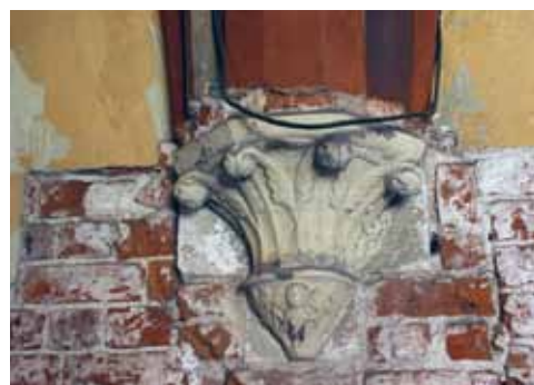
16. att. Rīgas Doms. Krusteja. A korpusa konsole (k–ko3)