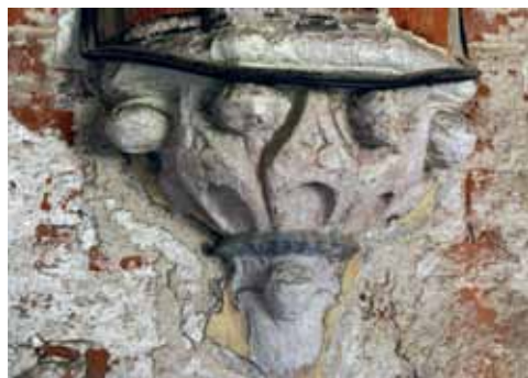
19. att. Rīgas Doms. Krusteja. R korpusa konsole (k-ko48)