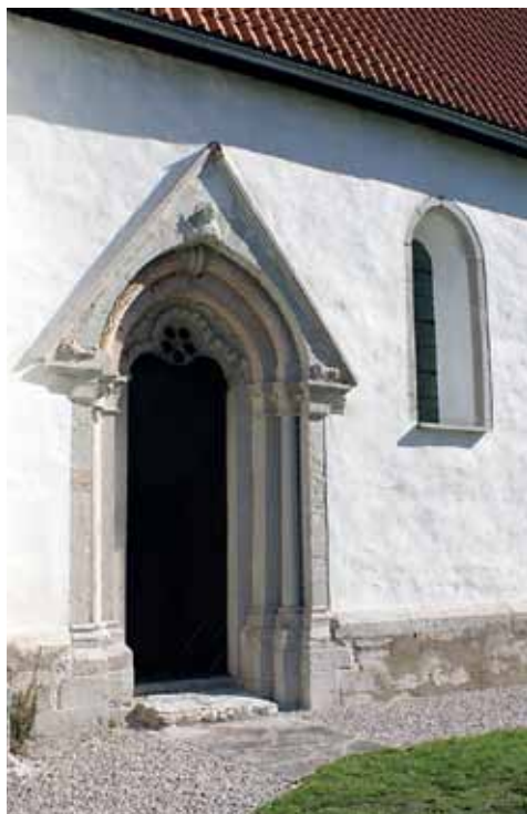
12. att. Veskindes baznīca. Kora portāls