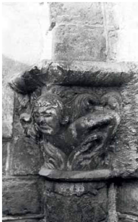
5. att. Rīgas Doms. Ziemeļu apsīdas kapitelis (a–k8), t.s. būvmeistara kapitelis VKPAI (Latvijas mākslas vēstures interneta portāla materiāls)

atdarinājumiem raksturīgas iezīmes kā formu vienkāršošana un daļēji pat rupjš kaluma izpildījums (5. att.), kas ļauj apšaubīt kāda Ķelnes meistara līdzdarbību.