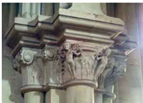
17. att. Magdeburgas Doms. Kora ejas kapitelis ar figūru dekoru

gas Domkapitula, gan arī uz bīskapa Nikolaja ciešiem kontaktiem ar Magdeburgas premonstriešu klosteri, ticams, ka nepastarpinātā veidā Rīgas Domā nokļuvuši pāris figurālo dekoru ikonogrāfiskie saturi un to netradicionālais attēlojuma veids. Runa ir vispirms par Rīgas Doma kapitula zāles ZA stūra konsoles dekoru ar pusfigūru pāri, kuru nenoteiktību un emocionālo pasivitāti papildina vienīgi stilizēta auga motīva zars un visnotaļ zīmīgs vienas figūras pie krūtīm piespiestas rokas žests (kz–ko10) (15. att.). Atribūts un atturīgais mājiens sasaucas ar Magdeburgas Doma kora ejas kapitēja figurālā dekora „Marijas Pasludināšanas” ainu. Piemērs datēts laika posmā no 1220. līdz 1240. g. 25 Mākslinieciskā ziņā Rīgas Doma konsoles drīzāk pieticīgais, proporcionālā ziņā neveikli darināto pusfigūru dekors ir tālu no Magdeburgas Doma piemēra. Rīgas konsoli, iespējams, darinājis kāds vietējais tēlnieks.