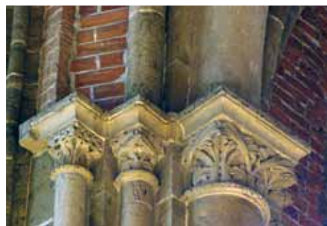
2. att. Brēmenes Dievmātes baznīca. Vidusjoma kapiteļi