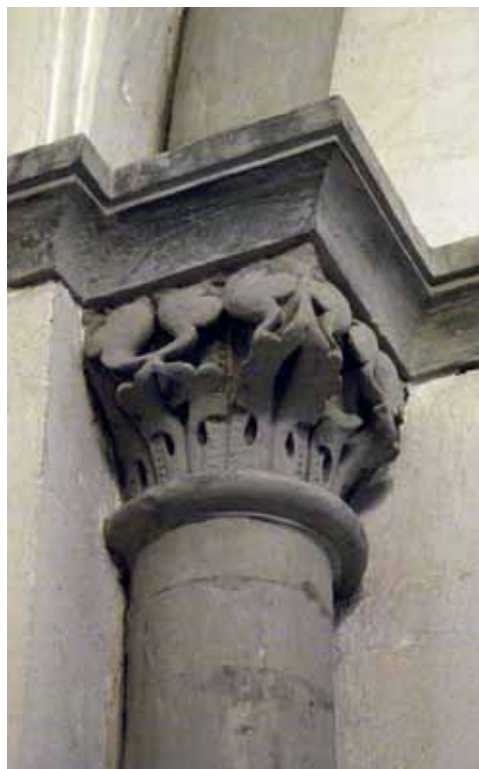
4. att. Lipšates Lielās Marijas baznīca. Interjera kapitelis