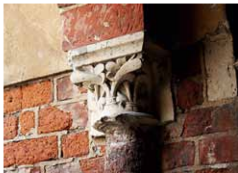
1. att. Rīgas Doms. Krusteja. A korpusa kapiteļis (k-k20b)

Pārliciecināša ir arī līdzšinējos pētījumos atpazītā būvmeistara kapiteļa (a-k8) kompozicionālā tuvība ar 13. gs. 20.–30. gados datētiem Gelnhauzenes ( Gelnhausen ) 13 Sv. Marijas baznīcas altāra kora daļu rotājotiem, no kapiteļiem izliekušos pusfigūru mo-