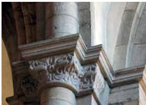
11. att. Visbijas Sv. Marijas baznīca. Interjera kapitelis