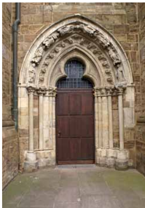
8. att. Mindenes Doms. Jaunavu portāls