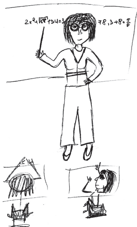
Zīmējums Nr.2. Latvija.

jā, Grieķijā un Bulgārijā kā tipisku skolotāja apģērbu atzīst džinsus, T-krekļus un puloverus. Iespējams, to var skaidrot ar atšķirīgiem priekšstatiem par tipiska skolotāja vecumu: Slovēnijas respondenti minējuši, ka klasiski, parasti un vecmodīgi ģērbjas tikai gados vecākās skolotājas 42 . Taču iespējams, ka skolotāja apģērbu ietekmē tradīcijas, kas Anglijā un Latvijā ārējā izskata ziņā ir visai konservatīvas.