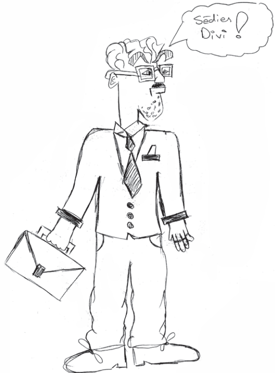
Zīmējums Nr.1. Latvija.

Tomēr atklāts ir jautājums — kā skolotāju profesijas feminizēšanos vērtē paši skolēni? Lai atbildētu uz šo jautājumu, svarīgi ir noskaidrot, kādas skolotāja īpašības asociētas ar dzimumu? Latvijas respondentu atbildes atklāja, ka skolotājs vīrietis tiek uzskatīts par pārāk stingru. Piem., kādā no zīmējumiem skolotājs ir attēlots ar bargu sejas izteiksmi, paužot lēmumu: „Sēdies, divi!” (sk. 1. zīm.). Negatīvu viedokli par skolotājiem vīriešiem izteikuši arī Anglijas skolēni — skolotāji raksturoti ar tādiem vārdiem kā „nejauks”, „īgns” un „aplusti!” 33 . Savukārt skolotāja sieviete asociējas ar smaidu, maigumu un rūpēm. Taču arī viņa tiek kritizēta: Slovēnijas skolēni raksta, ka “vīrieši skolotāji parasti ir jautri un