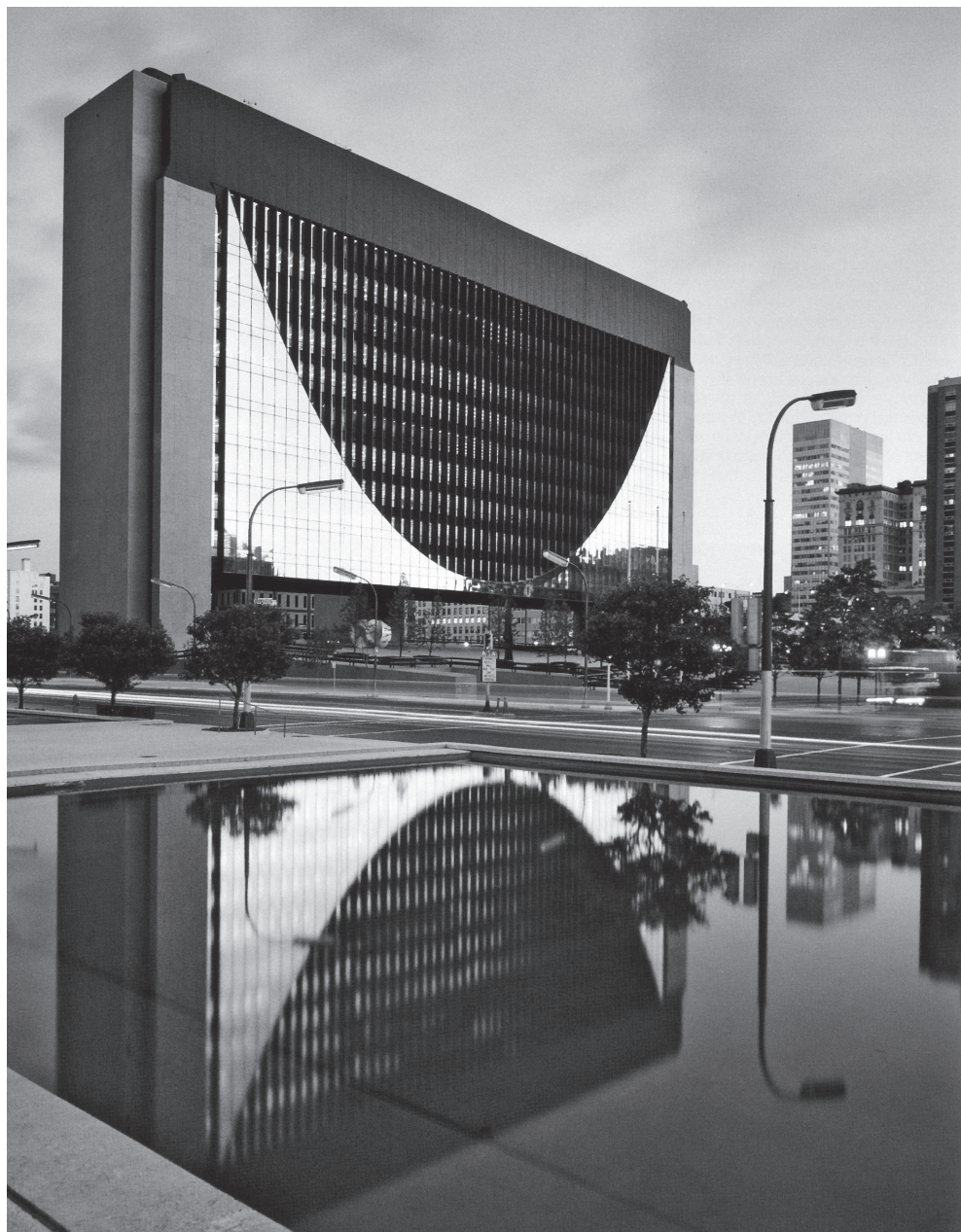
Federālo rezervju banka Mineapolē, ASV. Arhitekts Gunārs Birkerts