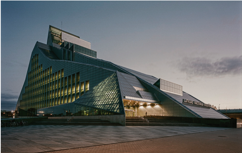
Latvijas Nacionālā bibliotēka. Arhitekts Gunārs Birkerts