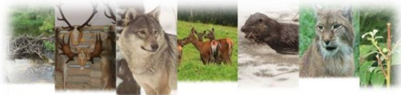
LATVIJAS MEŽZINĀTNES DIENA