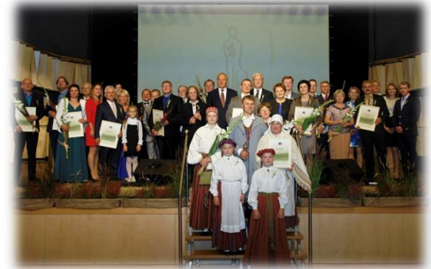
Konkursa «Sējējs 2014» uzvarētāju apbalvošanas pasākums

Darba « Moderna piena ražošanas ferma: tehnoloģija, tehnika, apsaimniekošana » autoru kolektīvam, t.sk., LLMZA locekļiem