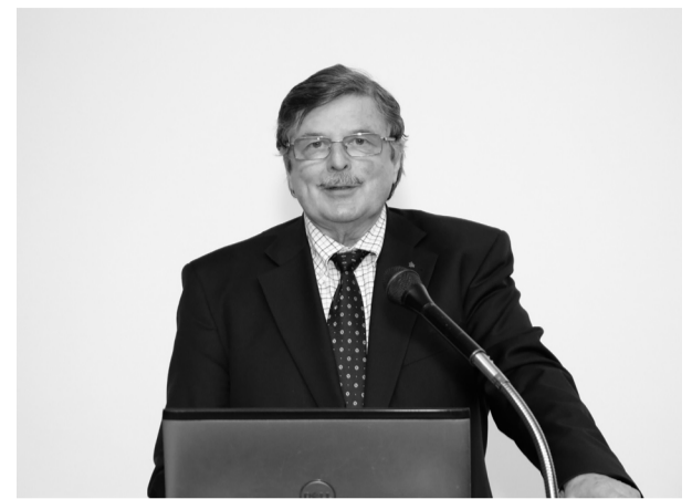
Juris Krūmiņš LZA Pavasara pilnsapulcē 2018. gada 7. aprīlī

Atspaidis LZA darbībai ir LZA dibināto fondu darbība: 1) Nodibinājums "Zinātnes fonds" (sabiedriskā labuma organizācija, darbības joma – zinātnes veicināšana, valdē 6 LZA pārstāvji, 2017. gadā "Zinātnes fonds" atbalstīja Gada balvas zinātnē laureātu godināšanas ceremoniju un četru Latvijas zinātnieku vizīti Ķīnas TR universitātēs; 2) LZA struktūrvienība LZA Fonds (ziedojumu atlikums 2017. gada beigās 140,4 tūkst. EUR).